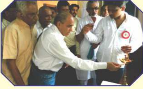
દિપ પ્રગટાવતા મહાનુભાવો