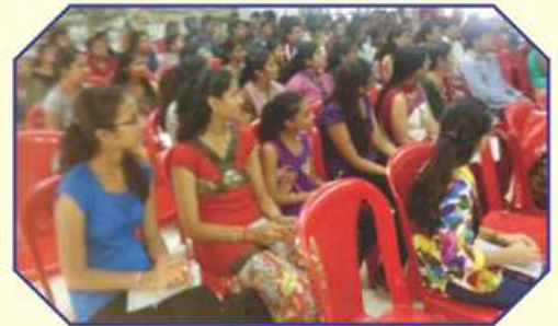
उपयोगी मार्गदर्शन सेमीनारमां व्यस्त विद्यार्थीओ अने युवाओ