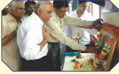
મહાકાળી માતાજીને ચુંદડી અર્પણ તથા હારારોપણ કરતા મહાનુભાવો