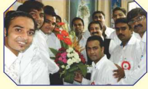
કોંગ્રેસ કચ્છી ગુજરાતી સેલના પદાધિકારીઓનું સન્માન કરતા શ્રી સ્વસ્તિક ગ્રુપના કાર્યકરો