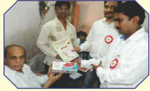
રક્તદાન બાદ શ્રી સ્વસ્તિક ગ્રુપ દ્વારા દરેક રક્તદાતાને વિશેષ ભેટ અને પ્રમાણપત્ર