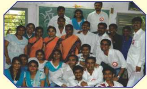
વાસન આઈ કેરની ટીમ તથા શ્રી સ્વસ્તિક ગ્રુપની ટીમ