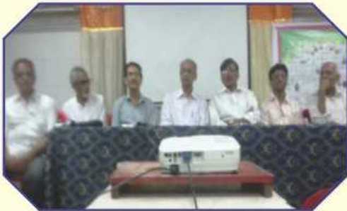
सेमीनार प्रसंगे पधारेला डोंबिवलीना कार्यकरो