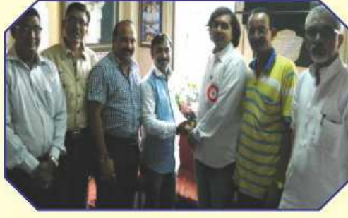
શ્રી ક.દ.ઓ. મંડળ ડૉંબિવલીના પદાધિકારીઓનું સન્માન કરતા શ્રી સ્વસ્તિક ગ્રુપના પ્રમુખશ્રી