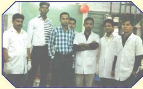
સેવા બ્લડ બેન્કના ડૉક્ટર તથા તેમની ટીમ