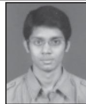
કેવલ કુલીન લોડાયા ભાંડુપ B.Com - 67%