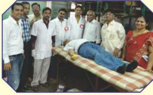
બ્લડ ડોનેશન કરતા રક્તદાતા